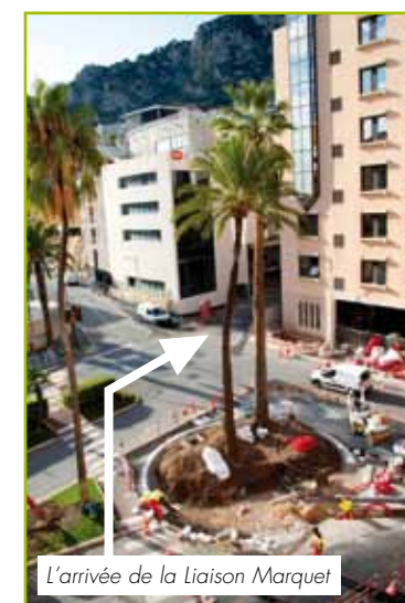
L'arrivée de la Liaison Marquet

nagements. Le schéma de circulation de Fontvieille en fait partie.