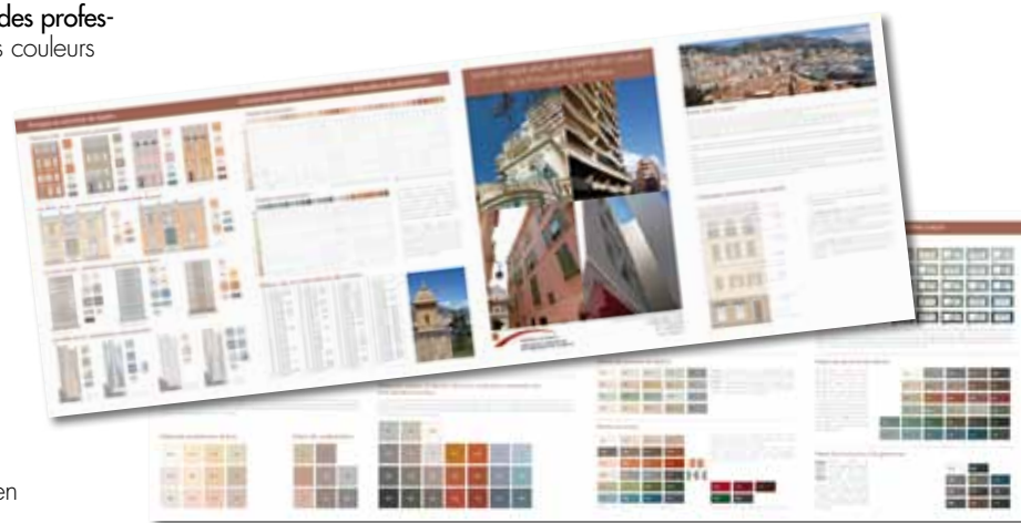
La brochure grand public éditée par la DPUM.

Des exemplaires de la nouvelle palette seront envoyés à tous les professionnels de la Principauté. Des brochures explicatives pour le grand public seront disponibles, sur demande, à la DPUM.