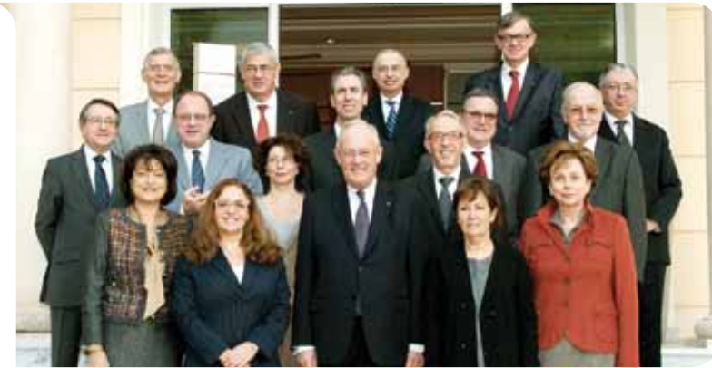
Autour du Ministre d'État et de Conseillers de Gouvernement, les Ambassadeurs de Monaco à l'étranger.

À l'occasion des célébrations de la Fête Nationale, le Département des Relations Extérieures a réuni l'ensemble du Corps diplomatique de la Principauté les 17 et 18 novembre, autour d'un programme centré sur l'attractivité de la Principauté.