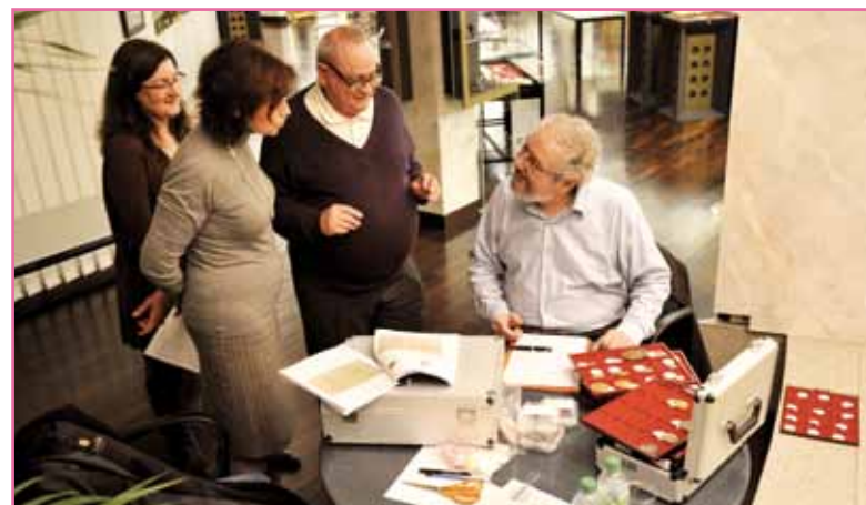
Les préparatifs de l'Exposition

Le 1 er et 2 décembre dernier, le Musée des Timbres et des Monnaies, sous la direction de l'Office des Émissions de Timbres-Poste (OETP), a présenté une exposition de monnaies, prêtées par de prestigieux partenaires, et de documents historiques, issus des Archives et de la Bibliothèque du Palais Princier.