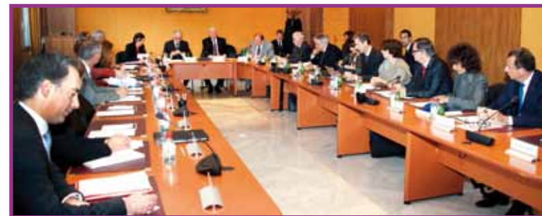
Réunion de travail au Ministère d'État

Le mardi 20 novembre, le Département des Relations Extérieures a organisé pour la deuxième fois une journée de réunions avec le Corps Consulaire de Monaco. Une journée de travail complémentaire où les points abordés lors de la conférence diplomatique ont été relayés auprès des Consuls de Monaco à l'étranger.