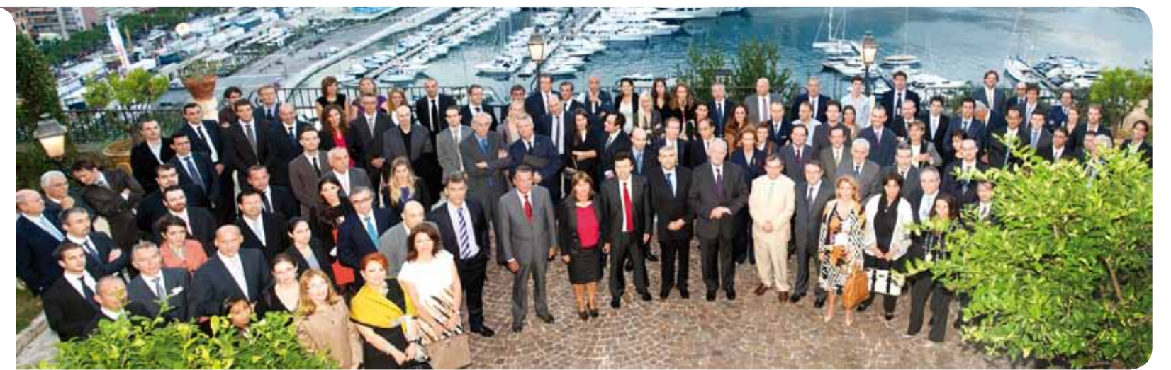
L'ensemble des participants à la réception du 23 octobre 2012

Au sein du Département des Affaires Sociales et de la Santé, la Commission d'Insertion des Diplômés travaille en parfaite collaboration et complémentarité avec le Service de l'Emploi, la Direction des Ressources Humaines et de la Formation de la Fonction Publique, ainsi qu'avec la Direction de l'Éducation Nationale, de la Jeunesse et des Sports (DENJS).