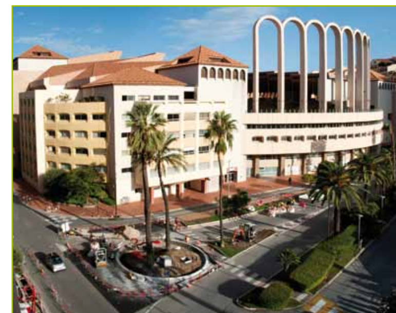
Création du nouveau giratoire, à l'arrivée de la Liaison Marquet

Ces quelques chiffres montrent pourquoi la mobilité est l'un des thèmes prioritaires de l'action du Gouvernement et nécessite de grands amé-