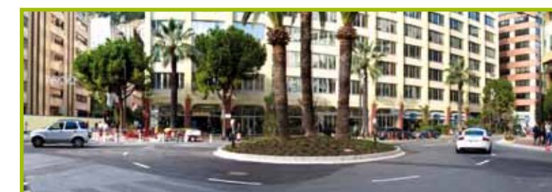
Le nouveau giratoire créé à l'angle de l'avenue des Castelans et de l'avenue Albert II

Autre changement notable, la Compagnie des Autobus de Monaco (CAM) voit le sens des lignes 5 et 6 inversé.